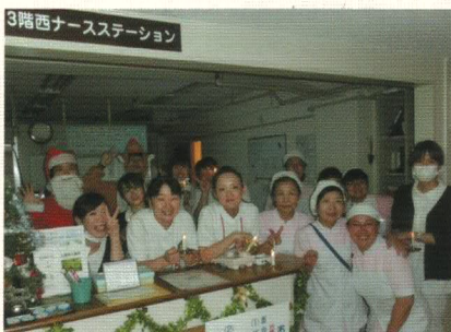
3階西ナーステーション

このような会は継続していきたいと改めて感じることができたキャンドルサービスでした。