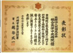
←越谷・高津消防署長 (中央)

平成27年1月12日の高津区消防出初式において、消防協力団体として高津消防署長表彰を受賞致しました。これまでの、高津消防署との救急受入れに関する合同情報交換会が高く評価されました。