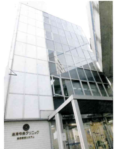
↑高津中央クリニック外観

日々受診者の皆さまに寄り添う健診機関として、総合高津中央病院はじめ関連施設の皆さまのお力も賜りながら、なお一層の努力を今後も続けていく所存でございます。今後ともよろしくお願い申し上げます。