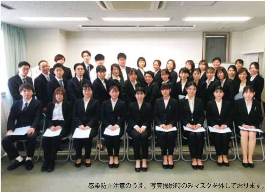
感染防止注意のうえ、写真撮影時のみマスクを外しております。