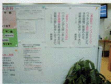
ワクチン接種掲示