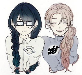
心の天使と見た目の天使 (外見だけでは分からない)

もちろん最終診断は細胞診や病理診断にゆだねられるため、生検の必要性には変わりありません。慢性疾患で通院されている患者さまや検診で異常を指摘された方々は、ぜひ年に1度の超音波検査をお勧めします。