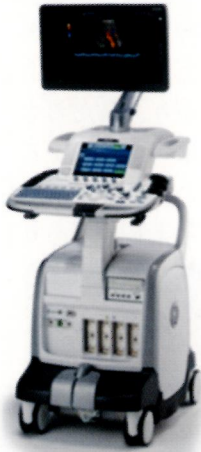
当院の使用装置 GE社製 LOGIQ E9

昨年暮れよりカテーテル室が増設され、2台体制で血管内治療を行う体制ができたことにより、今まで以上に外部からの検査や治療依頼、救急搬送に対し、スムーズかつ迅速に対処する事ができるようになりました。これに伴いエコーも検査範囲（検査科目）も増え、生理機能検査室はフル稼働状態で頑張っています。