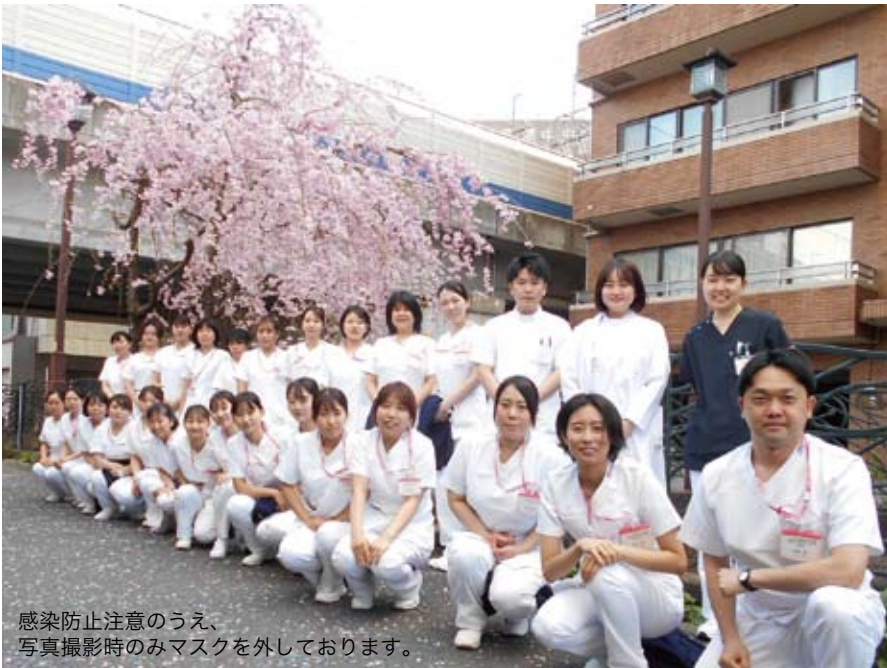
感染防止注意のうえ、 写真撮影時のみマスクを外しております。

「よろしくお願ひ致します！」 (看護部 25名・薬剤部 1名・ 画像診断部 2名)