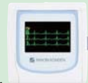
ホルター心電計（新）