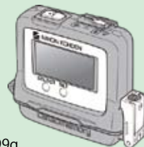
ホルター心電計（旧）

院外からの紹介により、検査のみの依頼も受け付けておりますので、かかりつけの先生にご相談いただき、各医療機関より生理機能検査室までご連絡いただきますようお願いいたします。