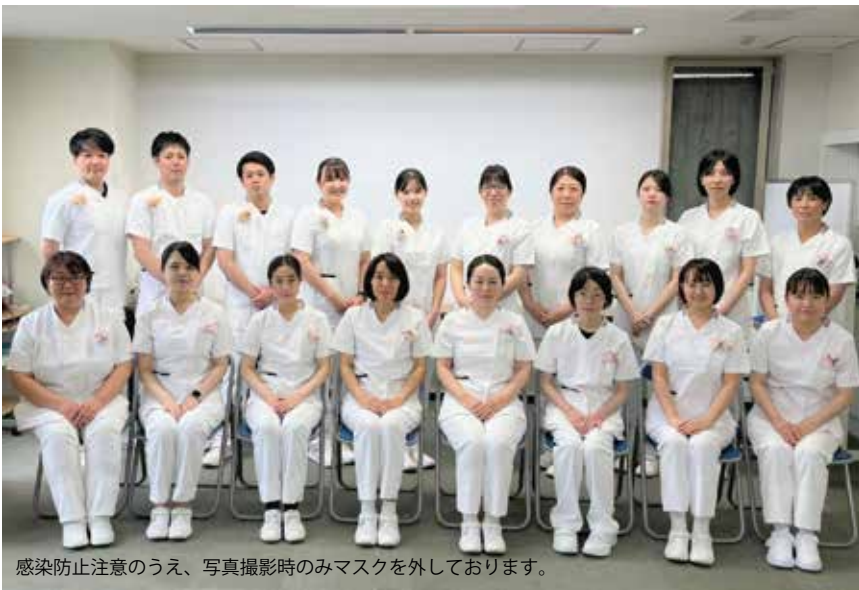
感染防止注意のうえ、写真撮影時のみマスクを外しております。